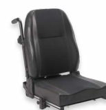
2111 + 2142 + 2173