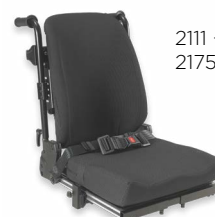
2111 + 2175