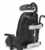
Vista posterior do Encosto Flex 3 com encosto reclinável elect.