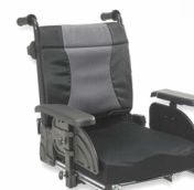
2111 +2142 +2171